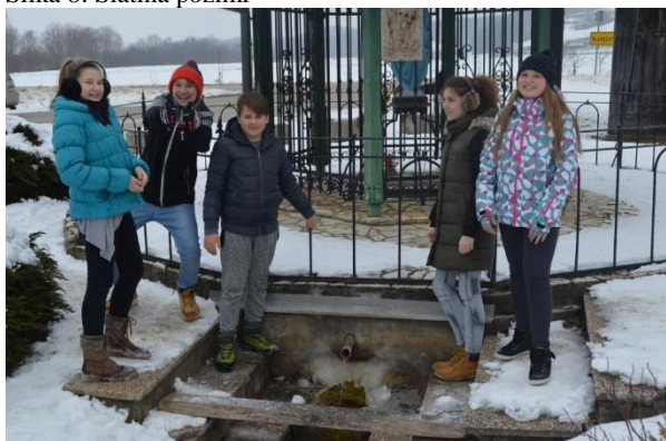
Slika 8: Slatina pozimi