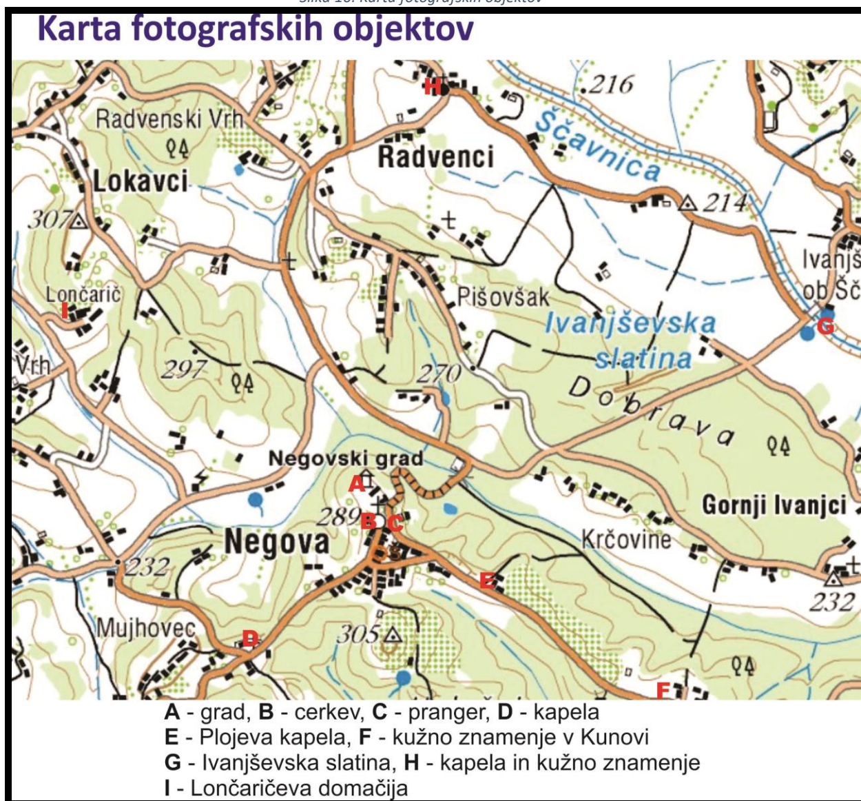
Slika 16: Karta fotografskih objektov

spomenik. Ob vrnitvi na grajsko dvorišče čaka udeležence pogostitev, ki so jo pripravili lastniki turistične kmetije Firbas. Nato za udeležence sledi ogled kulturnega programa, ki ga pripravijo članice turističnega krožka. Medtem pa komisija s svojim ostrim očesom za dobro fotografijo oceni delo mladih. Najboljše fotografije se bodo natiskale in razstavile v gradu. Preden se dan prevesi v večer se razglasi najboljše fotografije in nagradi najboljše fotografe. In da se zaključi dan, kot je treba, za lačna usta poskrbi turistična kmetija Firbas za veselo druženje do odhoda domov pa mladi sami.