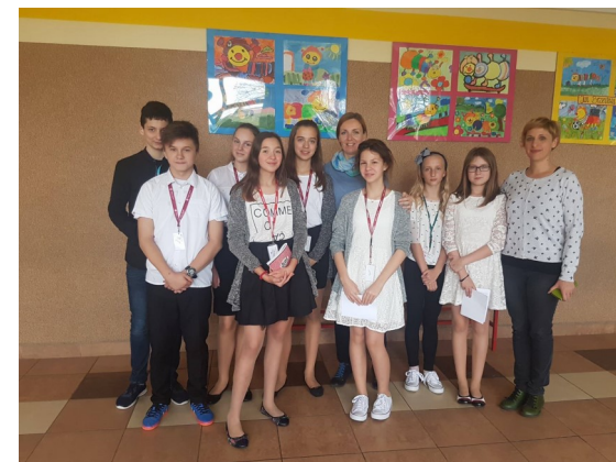
Projektni sestanek na Poljskem, oktober 2017

Rezultati projekta bodo spletne objave (novice, zgodbe, stripi), igre (namizne, jezikovne, strateške, računalniške in na prostem), brošure z legendami, videoposnetki, razstave iger, fotografij, plakati, stenske slike, različne predstavitve, šolske gledališke predstave, lipdub, učni programi in priprave, prispevki v medijih, izdelki in materiali.