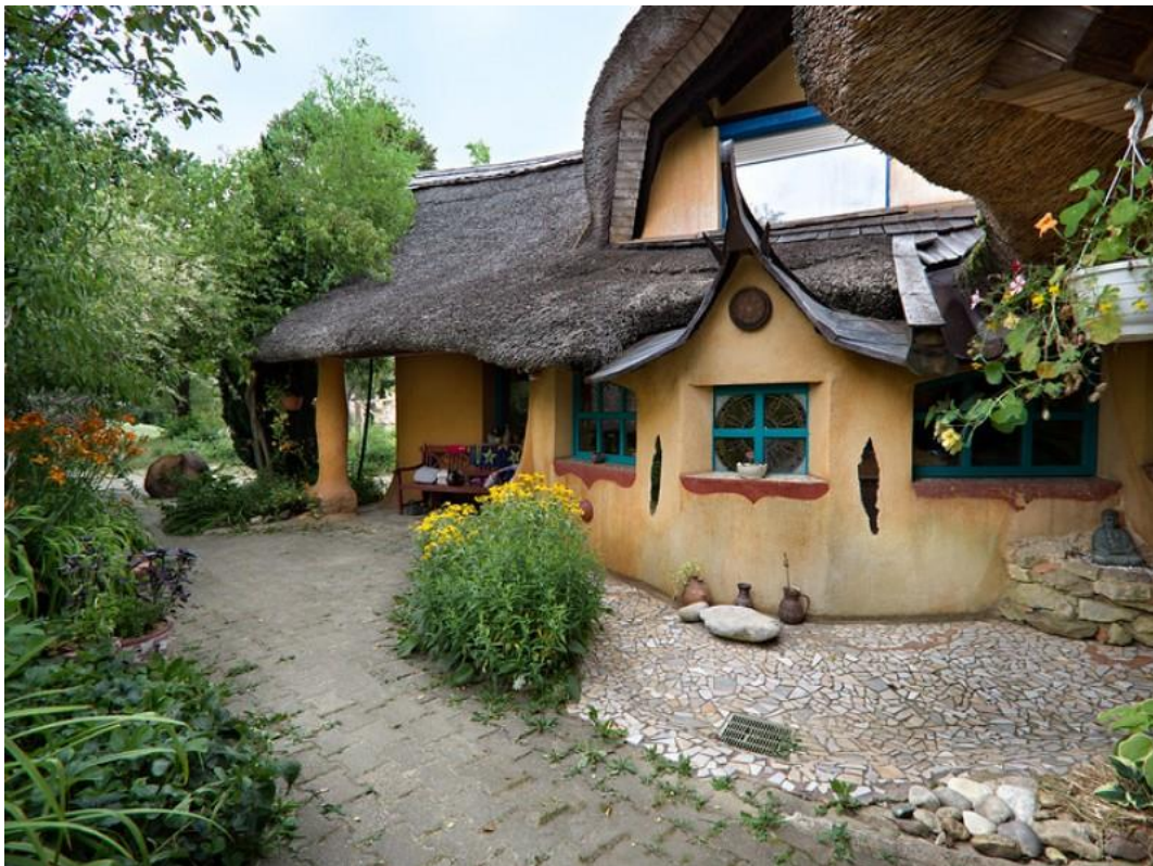
Slika 7: Pachamama center v Kunovi

Foto: http://www.regiovitalis.si/img/w800-c4x3/upload/gallery/14/zavodpachamamacenter_2.jpg , 2005