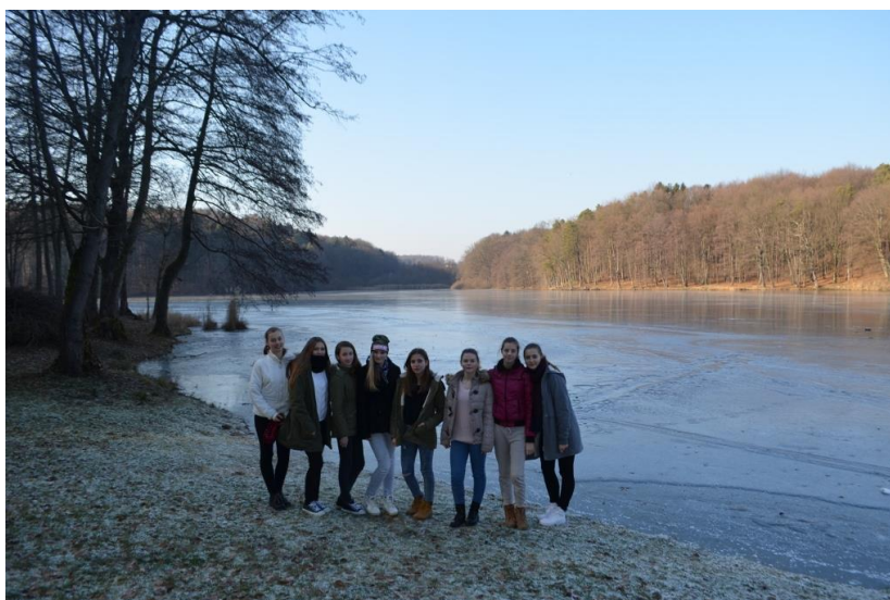
Slika 6: Negovsko jezero pozimi

V preteklosti je bilo Negovsko jezero zelo popularno za mlade, kajti ob robu jezera so naredili lesene bazene. Tam so se mladi najraje zbirali in kopali. Danes je dno jezera poraslo z muljem in je onesnaženo. Čeprav je jezero skoraj zapuščeno, se krajanji trudijo za obnovitev jezera in povrnitev nekdanje slave.