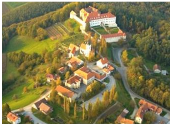
Slika 1: Negova iz zraka

Negova je naselje v občini Gornja Radgona. Negova je tudi središče krajevne skupnosti Negova, ki zavzema 8 naselij, in sicer naslednja naselja: Gornji Ivanjci, Ivanjševci ob Ščavnici, Ivanjševski Vrh, Kunova, Lokavci, Negova, Radvenci in Rodmošci. Negoizelo, kot je bila poimenovana današnja Negova, je starodavno mesto, katero je staro že 900 let. Je naselje z gručastim jedrom na terasi zahodno od osrednjega dela Ščavniške doline na nadmorski višini 285 metrov. Čeprav je Negova po velikosti majhna, ima veliko kulturnih in naravnih znamenitosti. Na hribu blizu cerkve je stal in še stoji vsemogočni negovski grad. Grad se prvič omenja leta 1425, ko je bil v lasti plemičev Windenskih. Po letu 1431 so grad osvajali različni lastniki. Najbolj znani lastniki negovskega gradu je bila družina Trautmannsdorf. V 17. stoletju je bil negovski grad najmočnejša posest med rekama Muro in Pesnico. Posest je bila velika, kar 540 hektarjev. Zato grad spada med pomembne spomenike kulturne dediščine. Ministrstvo za kulturo je leta 2003 pripravilo načrte za obnovo negovskega gradu, kajti v času požara so uničili velik delež gradu. Dan danes je negovski grad velik turističen produkt. V Negovi je tudi osnovna šola dr. Antona Trstenjaka Negova, katero obiskuje približno 110 otrok. Znanе osebe, katere so živele v Negovi, so dr. Anton Trstenjak, Ivan Kramberger in Matej Slekovec. Negovski prebivalci smo prijazni, sočutni in predvsem radi pomagamo. » Vku'p držmo !« kot je dejal dr. Anton Trstenjak.