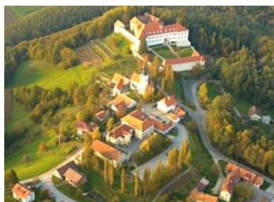
Slika 1: Negova iz zraka

Negova je naselje v občini Gornja Radgona. Negova je tudi središče krajevne skupnosti Negova, ki zavzema 8 naselij, in sicer: Gornji Ivanjci, Ivanjševci ob Ščavnici, Ivanjševski Vrh, Kunova, Lokavci, Negova, Radvenci in Rodmošci. Negoizelo, kot je bila poimenovana današnja Negova, je starodavno mesto, katero je staro že 900 let. Je naselje z gručastim jedrom na terasi zahodno od osrednjega dela Ščavniške doline na nadmorski višini 285 metrov. Čeprav je Negova po velikosti majhna, ima veliko kulturnih in naravnih znamenitosti. Na hribu blizu cerkve je stal in še stoji vsemogočni negovski grad. Grad se prvič omenja leta 1425, ko je bil v lasti plemičev Windenskih. Po letu 1431 so grad osvajali različni lastniki. Najbolj znani lastniki negovskega gradu je bila družina Trautmannsdorf. V 17. stoletju je bil negovski grad najmočnejša posest med rekama Muro in Pesnico. Posest je bila velika, kar 540 hektarjev. Zato grad spada med pomembne spomenike kulturne dediščine. Ministrstvo za kulturo je leta 2003 pripravilo načrte za obnovo negovskega gradu, kajti v času požara so uničili velik delež gradu. Dandanes je negovski grad velik turistični produkt. V Negovi je tudi osnovna šola dr. Antona Trstenjaka Negova, katero obiskuje približno 110 otrok. Znane osebe, katere so živele v Negovi, so dr. Anton Trstenjak, Ivan Kramberger in Matej Slekovec. Negovski prebivalci smo prijazni, sočutni in predvsem radi pomagamo. » Vku'p držmo !« kot je dejal dr. Anton Trstenjak