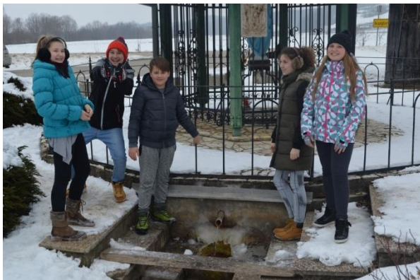
Slika 9: Slatina pozimi