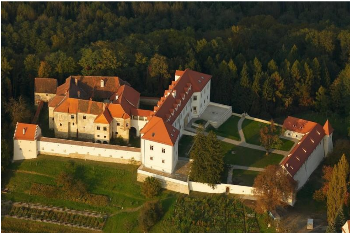
Slika 3: Negovski grad iz zraka

Renesančna, dolga in podkletena stavba, ki zakriva pogled (od vhoda) na stari del gradu, je bila zgrajena 1615, imenovana tudi novi grad, v času lastništva Maksimiljana Trautmannsdorfa, rojenega 1584 (bil je verjetno najpomembnejši iz rodu Trautmannsdorfov, ki so bili lastniki gradu vse do 2. svetovne vojne, leta 1993 pa so zadnjič obiskali Negovo).