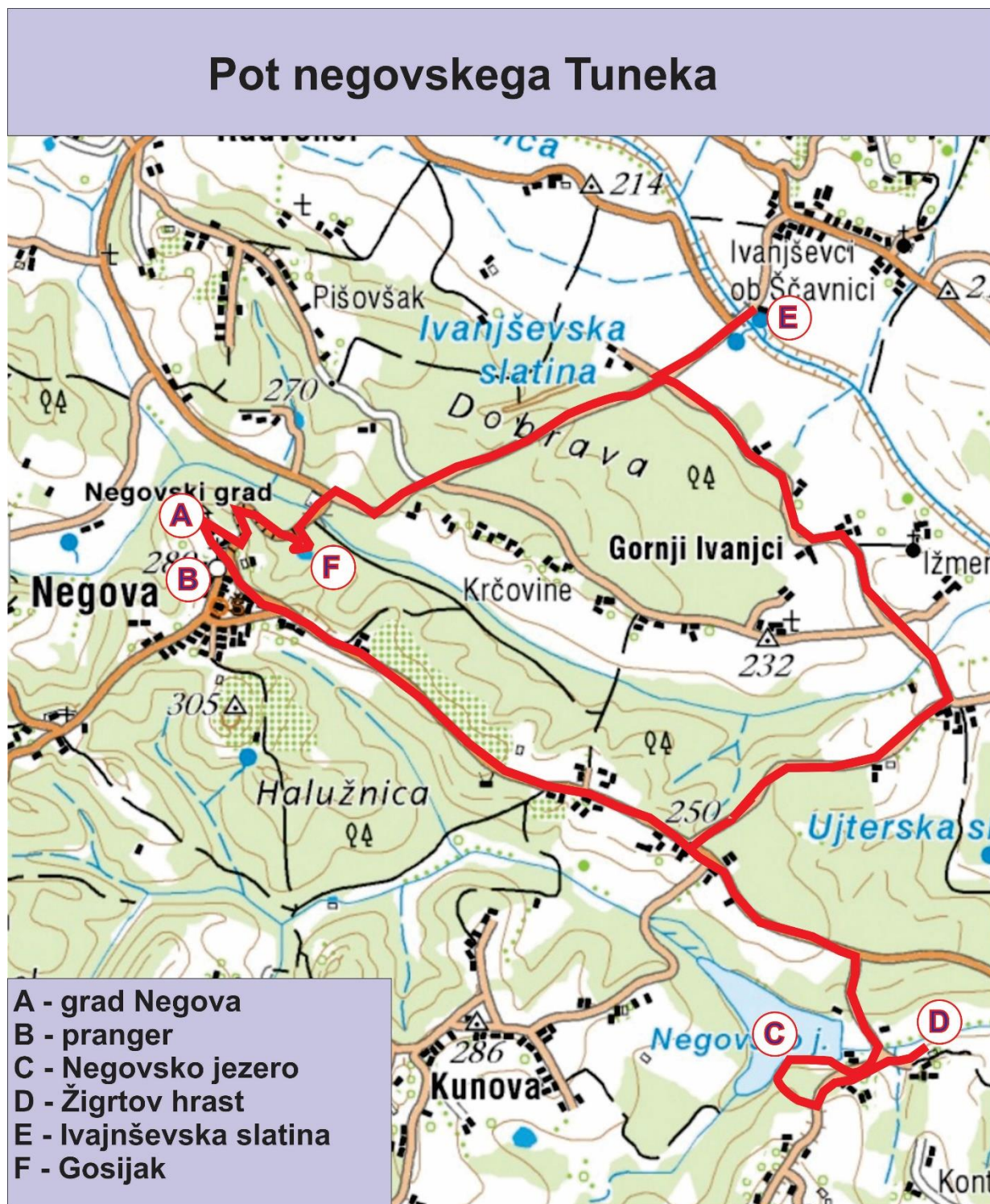
Slika 13: Zemljevid poti

bomo pri vsaki točki zapisali še Tunekov domač opis točke.