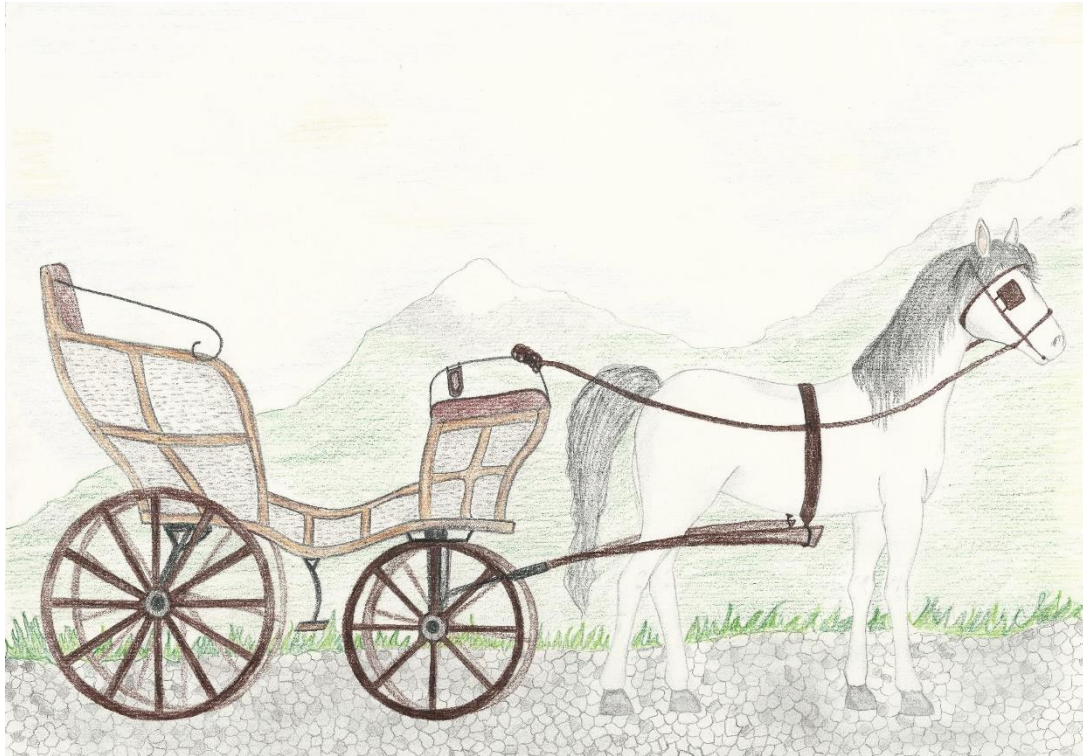
Avtor: Tjaž Starovasnik

Za spominek smo se odločili, da bomo izdelali leseni obesek za ključe z napisom Tunek, na drugi strani pa napis Negova 2016. Zloženske in obeske za ključe boso dobili vsi obiskovalci naše stojnice na predstavitvi v Mariboru.