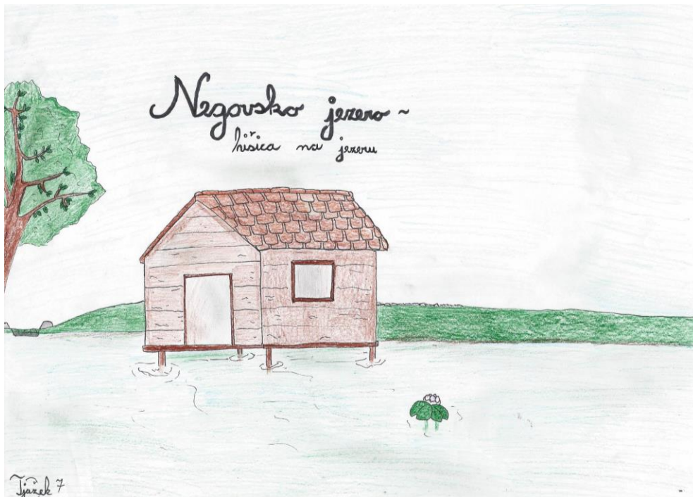
Slika 15: Zmagovalna risba likovnega natečaja

Med učenci tretjega triletja smo izpeljali likovni in literarni natečaj. Tema likovnega natečaja je bila Hišica na jezeru, na natečaj se je odzvalo kar nekaj učencev. Kot najlepšo risbico smo izbrali risbico učenca Tjaža Starovasnika iz 7. razreda.