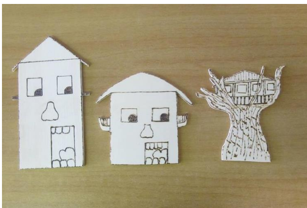
Slika 16: »Prototipi« spominka z zmagovalcem na sredi

Odločili se smo, da bomo vse udeležence taborjenja nagradili z lesenim obeskom za ključe. Obesek bo v obliki hišice, na hrbtni strani bo zapisan datum in zgodba o Žigi in jezerski vili. Obeske bomo uporabili tudi za promocijo našega dogodka. Izdelali smo tri prototipe hišic in se potem na podlagi različnih mnenj odločili za obliko, ki najbolj spominja na originalno hišico na jezeru. Želeli smo, da je hišica malce šaljiva in nagajiva, saj bo takšno tudi naše taborjenje.