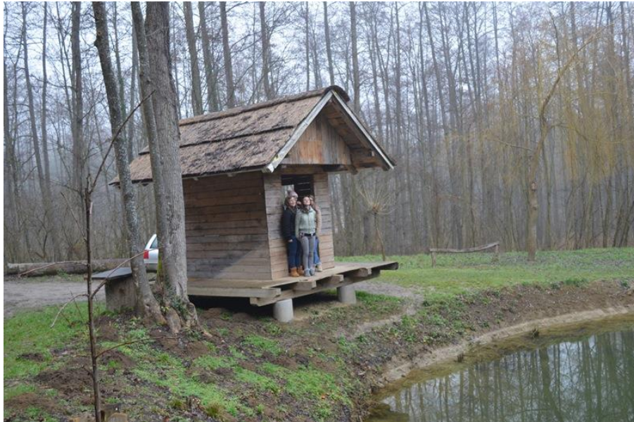
Slika 7: Hišica na Gosijaku

Podobna hišica, kot je nekoč stala na Negovskem jezeru, stoji tudi ob grajskem ribniku imenovanem Gosijak. To hišico smo si člani turističnega krožka ogledali in bili nad njo navdušeni. Kako lepo bi še bilo, če bi takšna hišica spet krasila Negovsko jezero.