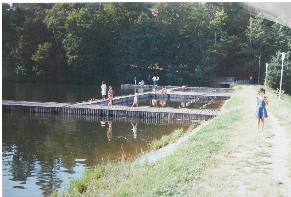
Slika 3: Leseni bazeni na jezeru okoli leta 1980

V preteklosti je bilo Negovsko jezero zelo popularno za mlade, kajti ob robu jezera so naredili lesene bazene. Tam so se mladi najraje zbirali in kopali. Danes je dno jezera poraslo z muljem in je onesnaženo. Čeprav je jezero skoraj zapuščeno, se krajani trudijo za obnovitev jezera in povrnitev nekdanje slave