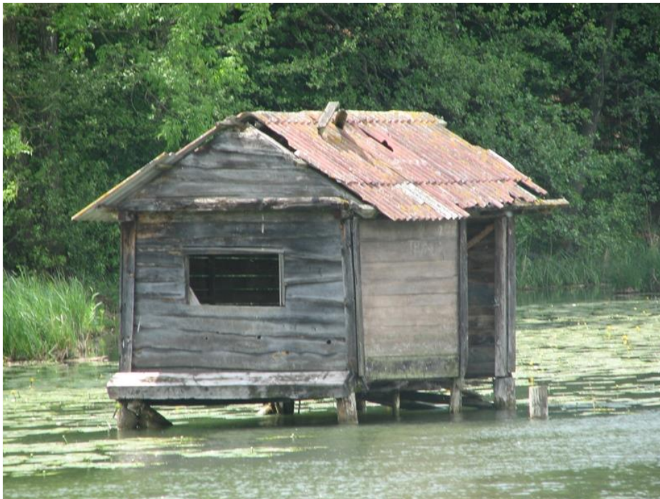
Slika 6: Hišica okoli leta 2010

Ko smo domačine spraševali o hišici na jezeru, se je vsem na obraz narisal nasmešek. Slišali smo zgodbe o prvih ljubeznih, o »špricanju pouka«, o tem kako so se pred starši skrili na hišico, da so se izognili kmečkega dela. Dostop do hišice je bil mogoč na tri načine, do hišice si lahko priplaval, priveslal s čolnom in v hudi zimi pripešačil po ledu. Hišica je zaradi dotrajanosti, leta 2013 bila odstranjena iz jezera.