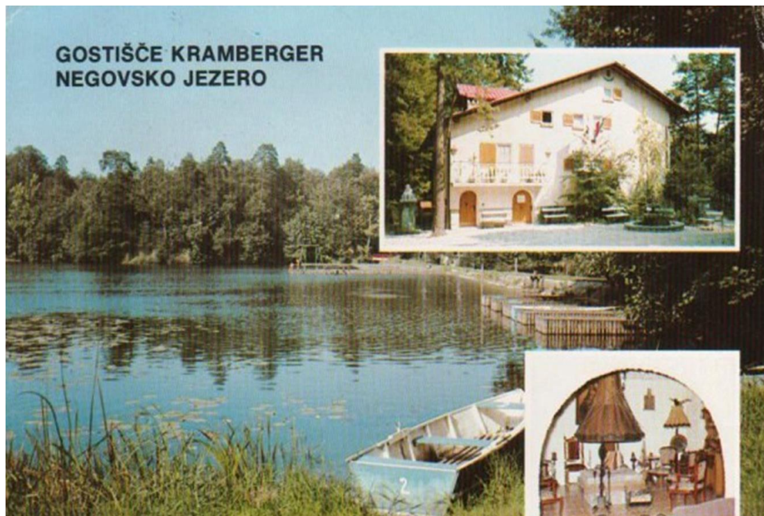
Slika 2: Negovsko jezero na razglednici okoli leta 1980

Krajinski park Negova in Negovsko jezero je zavarovan, kot krajinski park že od leta 1967. Sicer je ime Negova postalo znano širši javnosti v 80. letih zaradi Ivana Krambergerja (dobrotnik iz Negove). Okolica njegovega rojstnega kraja pa izstopa po svojih naravnih in kulturnih vrednotah. V krajinskem parku je središče Negove z gradom in skoraj celotna Kunova. Po nekaterih virih je velik le 177 ha. Opis v odloku, ki je parcelno natančen pa ga opiše večjega od 300 ha ( www.negova.si ).