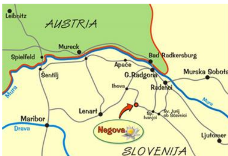
Slika 1: Negova

Negova, starodavno naselje, katerega prva omemba sega že v leto 1106, leži na obrobju Slovenskih goric. Je sedež istoimenske krajevne skupnosti, ki spada v občino Gornja Radgona. Krajevna skupnost Negova obsega osem vasi, ki ležijo v treh različnih geografsko-reliefnih enotah. Je naselje z gručastim jedrom na terasi zahodno od osrednjega dela Ščavniške doline na nadmorski višini 285 metrov. Okolje ima bogato kulturno in naravno dediščino.