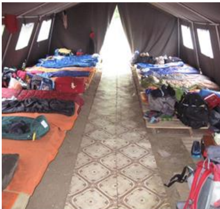
Slika 9: Šotor PD Gornja Radgona