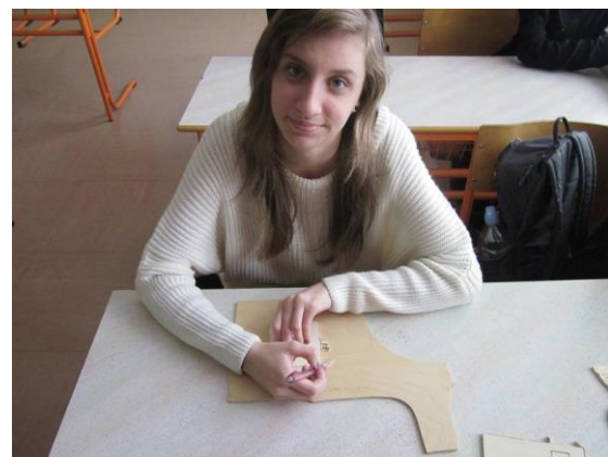
Slika 17: Izdelovanje spominka