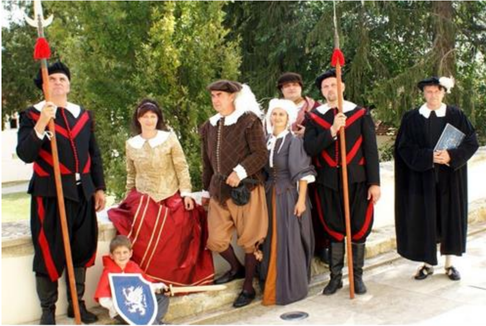
Slika 8: Prizor iz predstave Gorska pravda