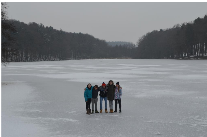
Slika 6: Negovsko jezero pozimi

V preteklosti je bilo Negovsko jezero zelo popularno za mlade, kajti ob robu jezera so naredili lesene bazene. Tam so se mladi najraje zbirali in kopali. Danes je dno jezera poraslo z muljem in je onesnaženo. Čeprav je jezero skoraj zapuščeno, se krajanji trudijo za obnovitev jezera in povrnitev nekdanje slave.